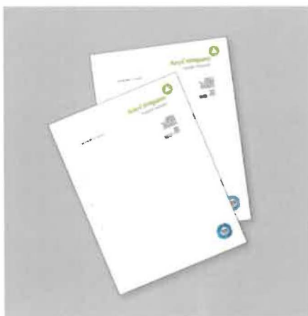
Používanie certifikačnej značky TÜV SÜD v obchodnej komunikácii.